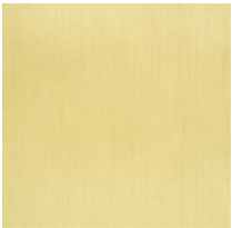
Laccato ottone satinato