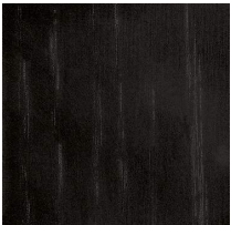
Frassino tinto nero poro aperto